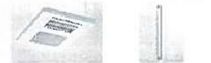
浴室乾燥機 21,000円/戸 手すりの設置 5,000円/戸