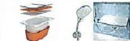
高断熱浴槽 27,000円/戸 新湯水栓 5,000円/戸